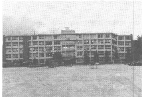
写真-3 市立西宮高校 A 棟 (南棟)