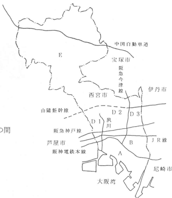
図-1 西宮市の地域分割図