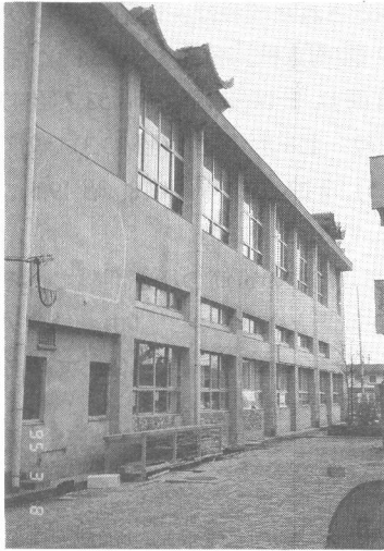
写真-1 甲東小学校体育館西側面

RC校舎についてみると表-5に示すように、B, C, E地区の被害は小さく、D2地区に被害が集中している。A地区で倒壊と判定されたものは香櫨園小南東棟であり、D1地区で大破(IV)と判定されたものは県立西宮北高北棟と南棟であり、D2地区で倒壊(V)又は大破(IV)と判定されたものは、甲陵中の2棟(南東棟)、上ヶ原小の2棟(管理棟)、及び県立西宮高D棟とE棟(芸術棟)、上ヶ原小北棟、上ヶ原南小南棟、上ヶ原中の3棟(北棟)、2棟(中棟)、及び、県立西宮高C棟(理科棟)である。写真-3に示すように、部分崩壊した市立西宮高A棟(南棟)は無被害の柱の数が多かったため、棟の被害としては中破(III)と判定されている。ここでも、部分倒壊した建物の被害度評価の難しさが再認識される。